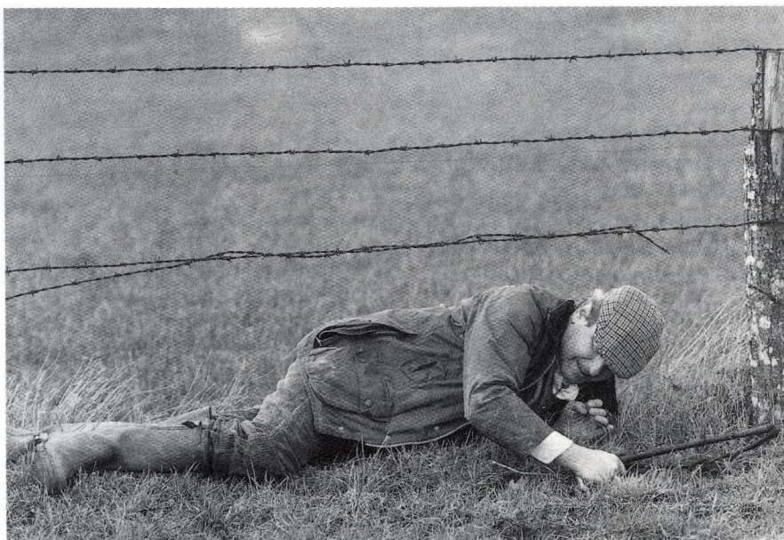
Le parcours du combattant d'un veneur de lièvre.

Cette ténacité sera récompensée. En effet, à treize heures trente, du côté de Bussignet, un capucin est lancé en plein bois par une meute bien gorgée... Une boucle derrière l'étang de la Combe, une pointe vers la route de la Jalousie, coupée deux fois : le bougre connaît bien la musique ! Mais les chiens sont toujours là : malgré un léger balancé, ils remontent leur animal de chasse.