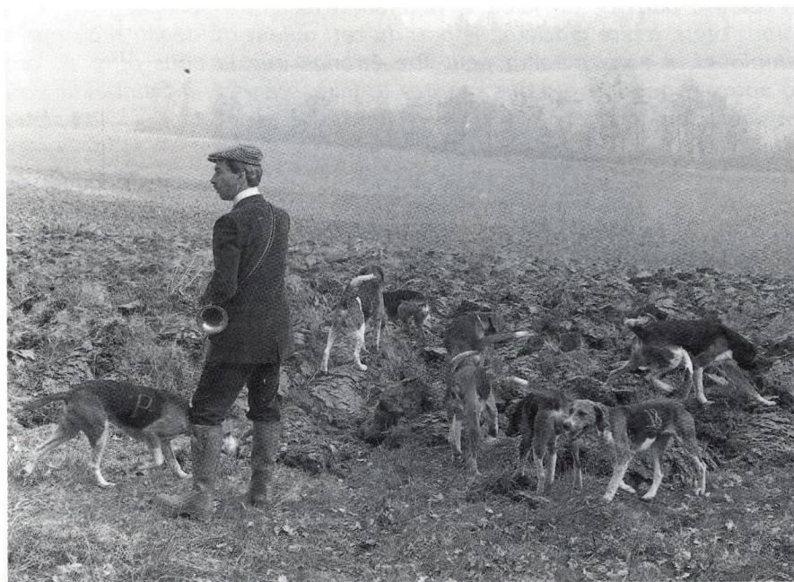
Le Maître d'Équipage du Rallye Neuvilleois avec ses chiens en débuché. A noter le numéro figurant sur le flanc gauche de chaque chien.

Messieurs les veneurs, merci, et à l'année prochaine !